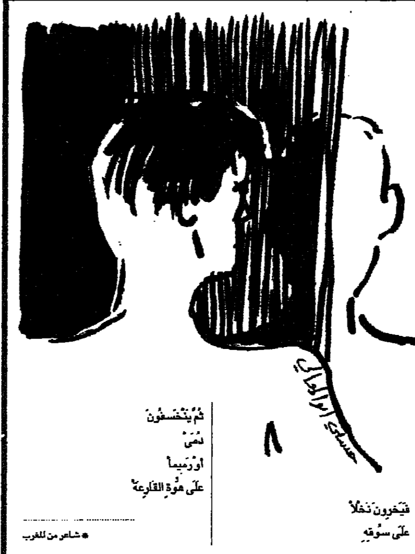
فيقولون نخلأ على سؤفة

والمعروف أن الغدامي يبحثه باطلالة من هذا هو ذلك تعرف بان الشواهد العارضة التي انتفع بها للكتابة على ما ذهب إليه لا تخفى بالمرآة فحسب، بل إن الرجل اليوم في الثقافة العالمية هو أيضا يصاحبه جنسية لم تعد خافية على أحد، وإن الحسي الجنسية لها تفسيرات تختلف باختلاف